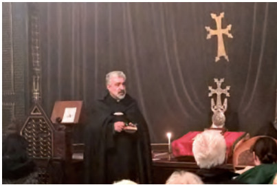
Hessgoum. Sermon de Der Dirain, prêtre de la paroisse d'Alfortville (16 mars 2018).