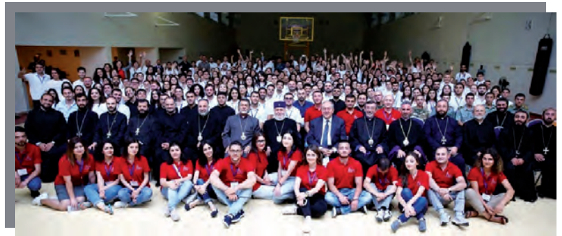
Les participants au HEHEM autour du Catholikos Karekine II.