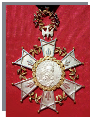
La Croix de St Vartan Mamigonian.

Le moment le plus émouvant de la journée était enfin arrivé : la remise des récompenses aux cinq personnes ayant participé il y a 60 ans à la construction de l'église encore parmi nous aujourd'hui. Et c'est ainsi que