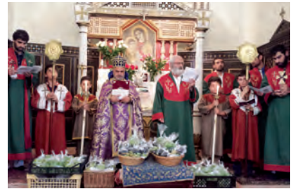
Assomption. Bénédiction du raisin (12 août 2018).