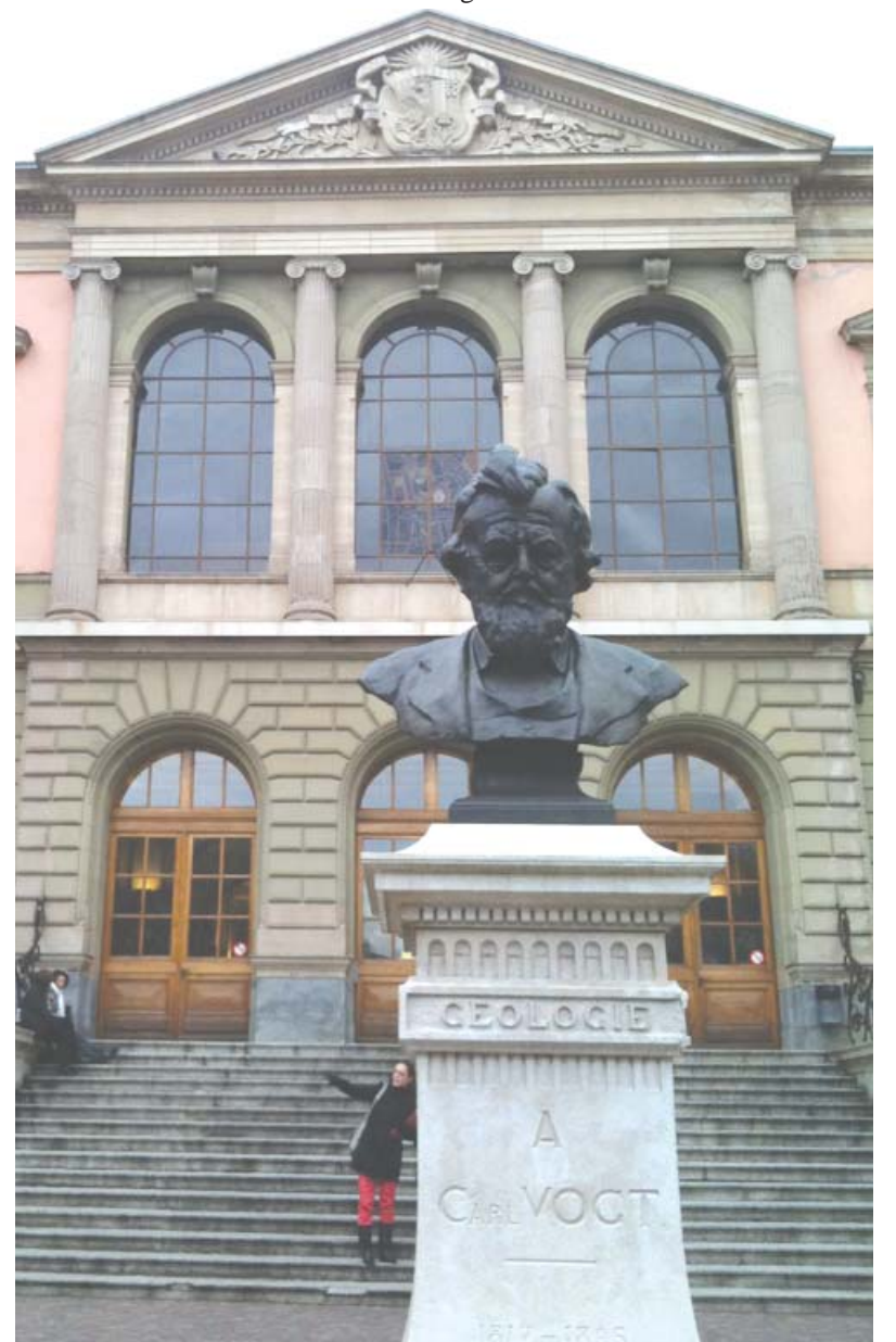
L'ancien bâtiment de l'Université de Genève