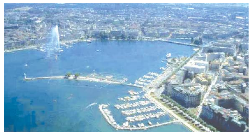
Genève. Photo panoramique, vue à vol d'oiseau

La première mention dans les sources arméniennes sur la Suisse remonte à la seconde moitié du XV e siècle. Il s'agit du travail de l'évêque Martiros Erzenkatsi dédié à son voyage au pays des Francs. Au cours des siècles XVII-XVIII les premiers marchands arméniens sont venus en Suisse d'Allemagne voisine, de France, et de Constantinople. Depuis la seconde moitié du XIX e siècle les étudiants arméniens ont commencé à arriver en Suisse pour faire leurs études à l'Université de Bâle, de Lausanne, de Genève, de Zurich et de Fribourg. Rappelons que les écrivains et poètes arméniens tels que Rouben Sevak, Avetik Isahakian et Derenik Demirtchian,