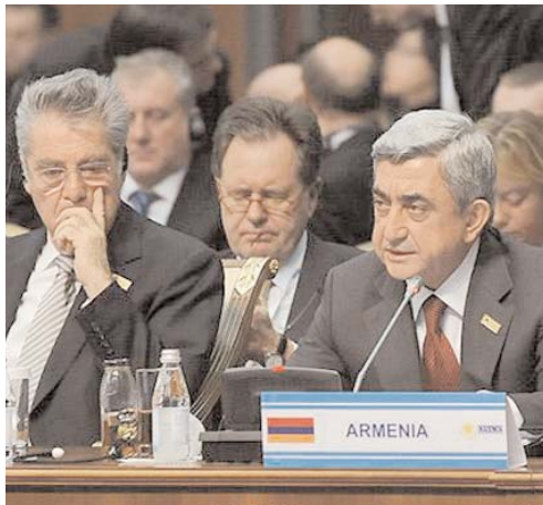
Serge Sarkissian (d.) au Sommet de l'OSCE

Récemment, à l'UNESCO, il a contesté les droits intellectuels au Khatchkar, les pierre-croix chef-d'œuvre de l'art chrétien arménien, insistant sur le fait que le Khatchkar n'est rien d'autre sinon un exemple de l'art azéri. Si cela avait été le cas, on peut se demander quelle était la raison d'être il y a cinq ans, de la destruction barbare de l'un des plus grands monuments de cet art, le cimetière médiéval arménien de Joga avec ses milliers de Khatchkars, et la construction à sa place d'un champs de tir militaire. Incidemment, cela est devenu l'incarnation actuelle d'une politique lancée de longue date et persistante pour l'éradication totale de l'héritage culturel arménien au Nakhitchevan, une région qui bénéficie du degré d'autonomie le plus élevé au sein de l'Azerbaïdjan.