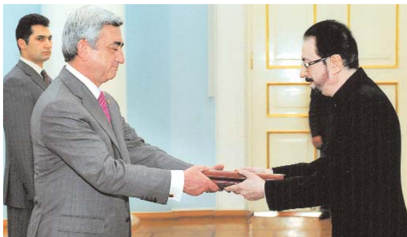
Ambassadeur Extraordinaire et Plénipotentiaire de la République d'Inde remettant ses lettres de créance au président de la RA Serge Sargsian

- Je suis persuadé que dans les quelques années à venir, il sera possible de renforcer encore l'excellente relation existante à de divers niveaux grâce à la poursuite du dialogue au plan politique, ainsi que par les mécanismes institutionnels mis en place, tels que la Commission intergouvernementale. Je suis également persuadé que les deux pays seront en