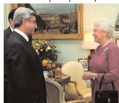
Serge Sargssian avec la reine Elisabeth II

Nous avons été témoins des épurations ethniques les plus brutales et de la politique d'expulsion.