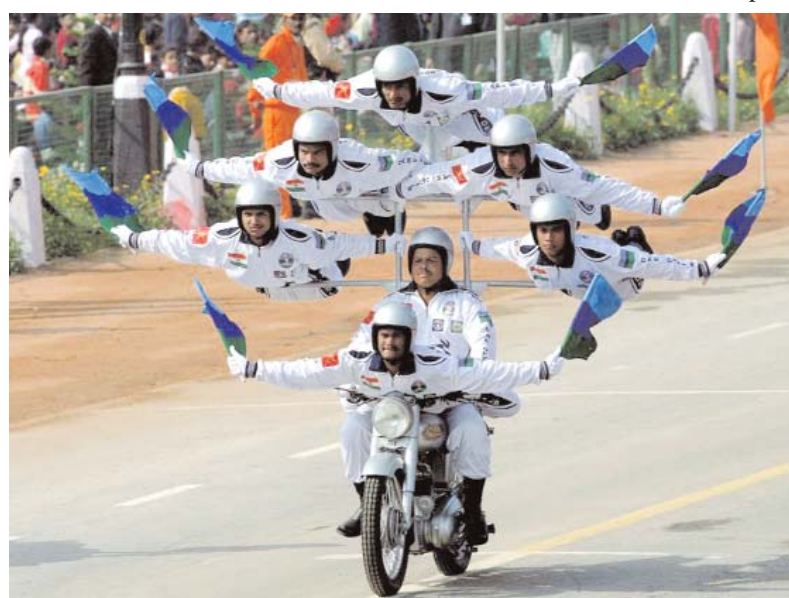
Episode de la parade du Jour de la République

mesure de donner plus de substance et de contenu aux relations bilatérales en faisant bénéficier l'autre de ses compétences dans