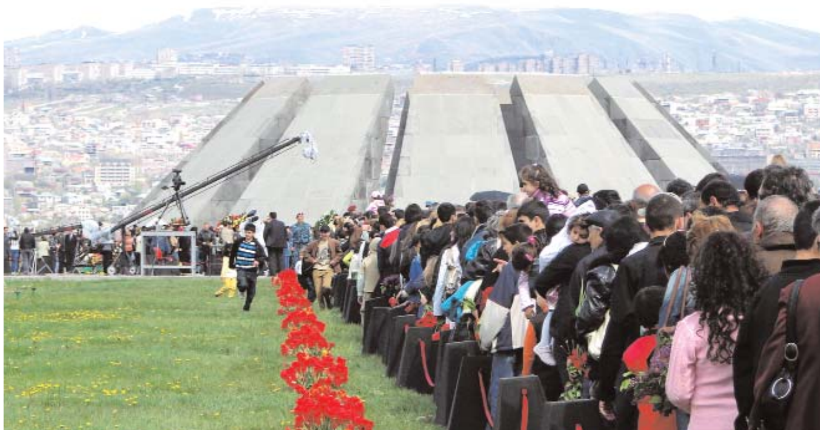
Comme toujours le 24 avril des milliers de gens visitent le Mémorial du Génocide