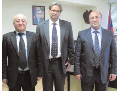
munauté arménienne de Catalogne. L'inauguration du katchkar arméno - espagnol en