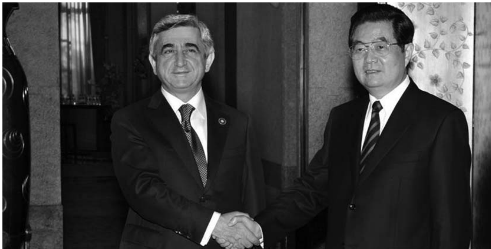
Pendant sa visite de 4 jours Serge Sargssian a rencontré le président chinois Hu Jintao (à droite), de célèbres hommes d'affaires.