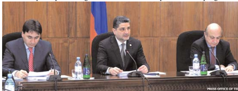
Séance de la commission gouvernementale

La commission a approuvé la liste des priorités du programme