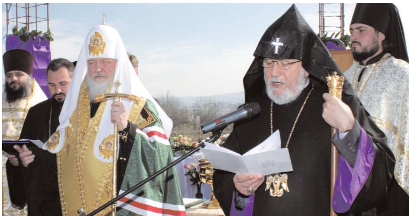
Le Catholicos Garéguin II et son hôte Kirill Ier prient lors de la fondation d'une nouvelle église russe à Erévan