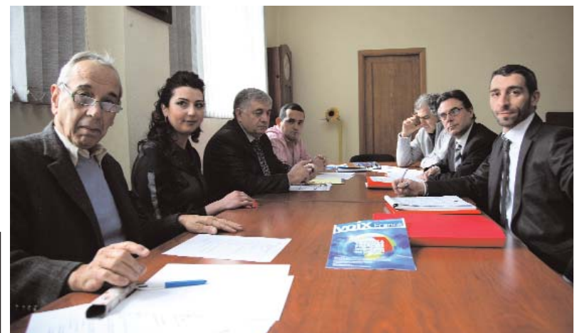
Pendant les séminaires