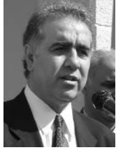
De Harut Sassounian Édité par The California Courier Éditorial de Sassounian du 3 septembre 2009

Après des mois de rumeurs et de fuites d'informations, les ministres des Affaires étrangères de l'Arménie et de la Turquie, la Suisse ayant joué le rôle de médiateur, ont fait une déclaration conjointe le 31 août, rendant public le texte de deux protocoles destinés à régulariser leur relation problématique.