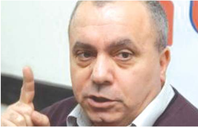
schéma criminel. Il a indiqué qu'après tout cela le ministre des Finances a déclaré que ce projet se prorogeait pour une période de 3 ans. "En réalité, ce projet ne sera pas mis en oeuvre, tout simplement le gouvernement ne souhaitait pas dire qu'il se trompait," a dit l'ancien premier ministre.

Tout en multipliant le nombre de travailleurs en Arménie par 5% du salaire minimum, il résulte que les gens investissent 300 millions de dollars, autant l'Etat, et cela en cas où le budget n'est pas approuvé, et selon la loi, on doit acheter des actions avec ses 600 millions de dollars. Selon Bagratian, c'est un