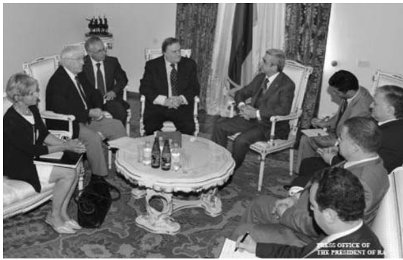
Colombier le 16 juin, le président arménien Serge Sargssian a déclaré qu'il appréciait hautement la coopération d'Arménie avec le