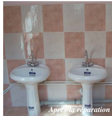
Après la réparation