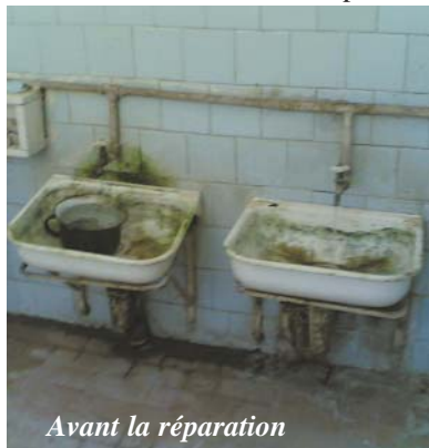
Avant la réparation

L'association prévoit de continuer le projet en Arménie. Encore un projet pour un autre jardin d'enfants est déjà écrit qui ne fonctionne pas actuellement car il se trouve en mauvais état. Cependant, il est très nécessaire aux enfants et leurs mères qui y habitent. Il s'agit du jardin d'enfants de Tsovaguyugh (région de Gégarkunik).