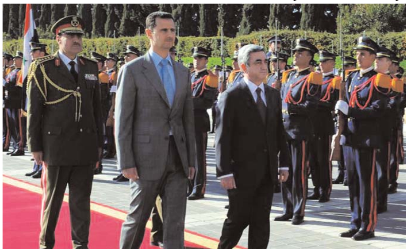
Bachar Assad et Serge Sargssian, présidents syrien et arménien

l'environnement, tout déplacement des forces internationales et