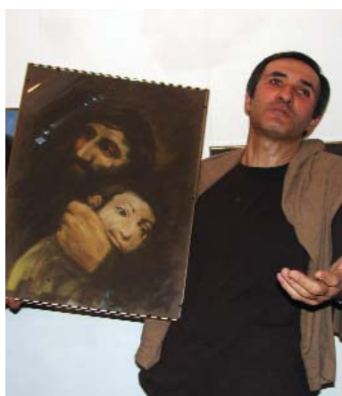
Jésus-Christe au visage du peintre Minas Avetissian

d'autres langues. N'est-ce pas qu'en outre ses exhibitions réussies sur les scènes parisiennes, Vardan a également eu des tournées aux États-Unis, respectivement, en