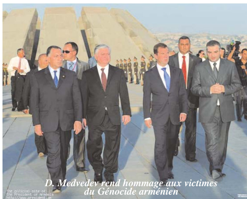
D. Medvedev rend hommage aux victimes du Génocide arménien

On a été au courant de la visite de la secrétaire d'Etat Hillary Clinton en Arménie il y avait deux