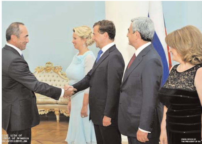
Ancien président Robert Kotcharian (à gauche) pendant le dîner de gala arméno-russe

- la vente éventuelle de deux missiles antiaériens S-300 à l'Azerbaïdjan, une situation militaire - politique pourrait se former où en cas de reprise des hostilités dans la zone de conflit du Haut-Karabagh, les conflits se limiteront seulement par le territoire de l'ancienne région autonome du Haut-Karabagh et par "la zone de sécurité" qui comprend 7 anciennes régions de la RSS d'Azerbaïdjan. Ce dernier est contrôlé par les forces arméniennes (armée de la défense de la République non reconnue du Haut-Karabagh et bénévoles d'Arménie).