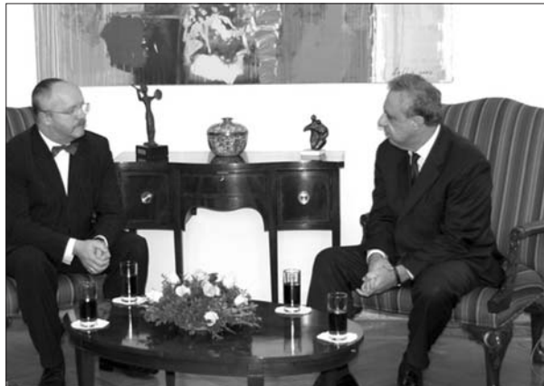
Juozas Olekas et Vardan Oskanian

En recevant le 12 novembre la délégation dirigée par le Ministre de la Défense Nationale de la Lituanie, Juozas Olekas, le Ministre des affaires étrangères de la RA Vardan Oskanian a exprimé de la satisfaction pour le niveau