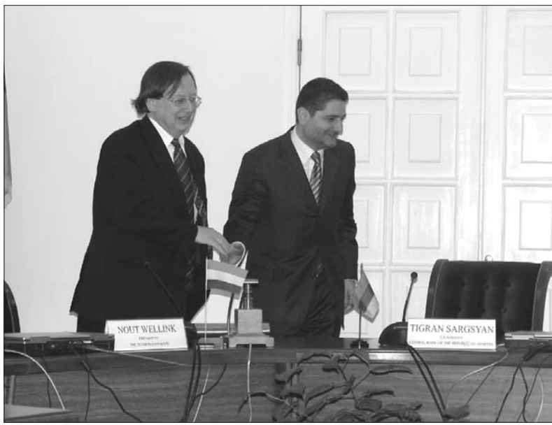
Nout Wellink et Tigran Sarkissian

"Haypost Trust Management" a été également créé par la société hollandaise "Postfinance". Il était prévu que le côté hollandais fonde en Arménie avec quelques organisations internationales une "Banque Postale" avec un capital de 5 milliards de drams (environ