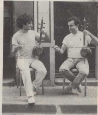
JEUNES MUSICIENS A MARSEILLE « Pardonner : oui. Oublier : jamais »