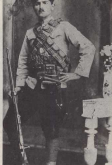
RÉSISTANT ARMÉNIEN (1915-1916) Le défaut de ne pas être turc

été donnés par les plus hautes autorités ; la préméditation était patente : sur ces deux points le grand historien britannique Arnold Toynbee, le pasteur allemand Lepsius (qui, dans un rapport circonstancié, demandait à Berlin de faire pression, pour que cela cesse, sur ses alliés turcs), l'ambassadeur des États-Unis, Henri Morgenthau, et Winston Churchill enfin sont tous formels.