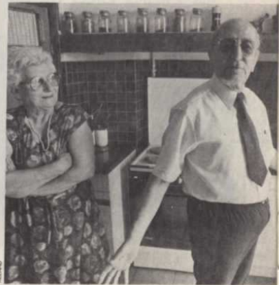
...ET AUJOURD'HUI A MARSEILLE ...toute sa vie »

Certes, les Édouard et les Émile continuent de parler l'arménien, mais leurs enfants ne l'ont pas toujours appris. Certes, ils aiment la cuisine arménienne, où le boulgour, le blé concassé, revient comme un refrain.