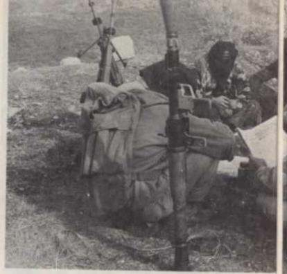
ÉLÉMENTS DE L'ASALA A L'EN « Nous n'étions

en temps Édouard allait à l'église arménienne de la rue des Brochets avec ses frères, mais c'était tout.