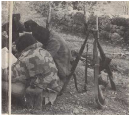
EN ns TRAINEMENT AU LIBAN (1981) plus des victimes »