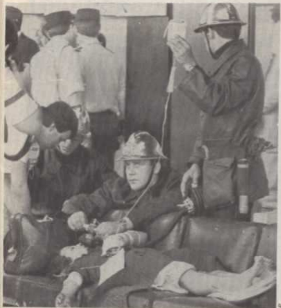
LES PREMIERS SECOURS APRÈS L'ATTENTAT D'ORLY, LE 15 JUILLET

nisations arméniennes n'ayant pas abouti à la moindre reconnaissance du génocide, une partie de la jeunesse s'est, dans un premier temps, désintéressée des problèmes de sa communauté.