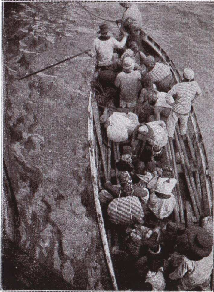
Embarcation chargée de réfugiés accostant le croiseur français.