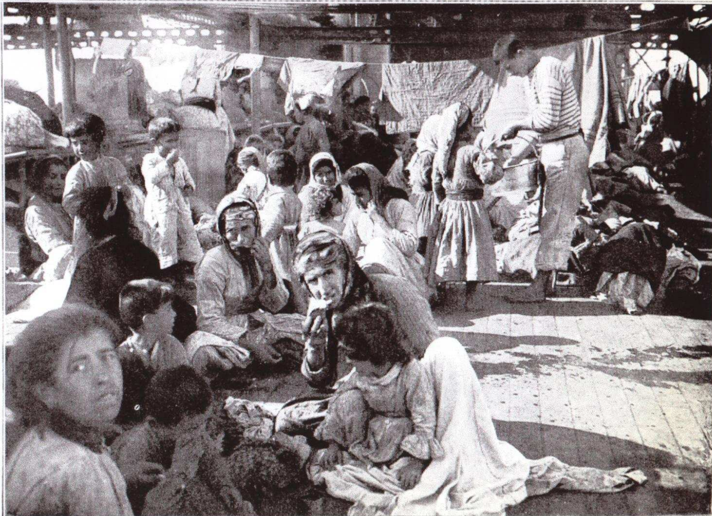
Le campement des Arméniens sur le pont du croiseur français qu'ils ont recueillis.