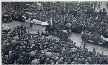
Les deux aspects du cortège: le carrosse traditionnel du lord-maire devant Saint-Paul et le défilé des automobiles dont l'une traîne un avion portant la cocarde française.