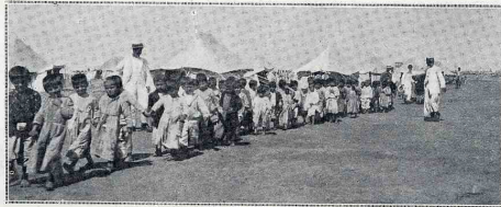
Jeunes enfants arméniens soustraits aux massacres turcs.

Près de Port-Saïd, un camp a été établi pour recevoir plus de quatre mille Arméniens que des marins français, à la fin du mois de septembre dernier, ont recueillis sur une côte de Syrie, au pied des montagnes où ils s'étaient réfugiés pour échapper aux Turcs, et dont nous avons, le 9 octobre, raconté la tragique odyssée. Ainsi se marqua de façon éclatante la protection séculaire que la France accorde aux chrétiens d'Orient. Désormais à l'abri des dangers et du besoin, les réfugiés, grâce aux soins dont les entourent la colonie et les troupes anglaises de Port-Saïd, se rétablissent des souffrances qu'ils endurèrent. Ils sont secourus par la Croix-Rouge anglaise et par le patriarche arménien du Caire. Il y a parmi eux de très nombreux enfants, des femmes et des vieillards, dont un centenaire. Quant aux hommes en âge de porter les armes, ils se sont engagés dans les rangs des armées alliées.