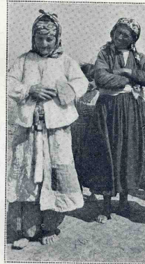
Vieilles femmes arméniennes.