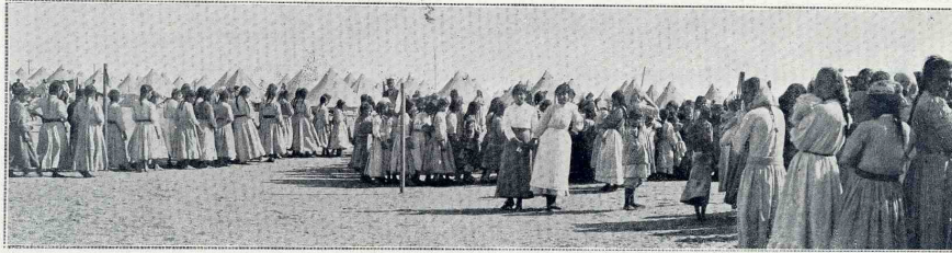
UN CAMP DE RÉFUGIÉS ARMÉNIENS A PORT-SAÏD. — Jeunes Arméniennes se dirigeant vers les tentes-écoles.