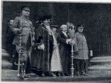
Le 727 e lord-maire de Londres sur les marches de Saint-Paul.

La procession qui escortait le lord-maire à travers la Cité ne comportait, en dehors des