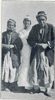
Le plus vieux couple du camp.

Près de Port-Saïd, un camp a été établi pour recevoir plus de quatre mille Arméniens que des marins français, à la fin du mois de septembre dernier, ont recueillis sur une côte de Syrie, au pied des montagnes où ils s'étaient réfugiés pour échapper aux Turcs, et dont nous avons, le 9 octobre, raconté la tragique odyssée. Ainsi se marqua de façon éclatante la protection séculaire que la France accorde aux chrétiens d'Orient. Désormais à l'abri des dangers et du besoin, les réfugiés, grâce aux soins dont les entourent la colonie et les troupes anglaises de Port-Saïd, se rétablissent des souffrances qu'ils endurèrent. Ils sont secourus par la Croix-Rouge anglaise et par le patriarche arménien du Caire. Il y a parmi eux de très nombreux enfants, des femmes et des vieillards, dont un centenaire. Quant aux hommes en âge de porter les armes, ils se sont engagés dans les rangs des armées alliées.