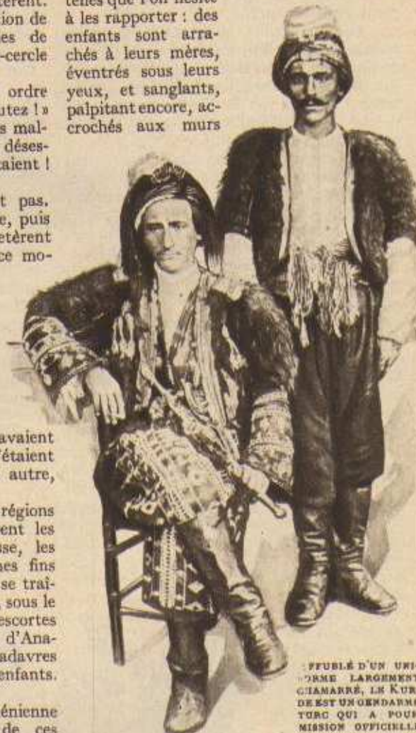
EFFRÉDÉ D'UN UNIFORME LARGEMENT CHAMARRÉ, LE KURDE EST UN GENDARME TURC QUI A POUR MISSION OFFICIELLE D'ASSASSINER LES ARMÉNIENS.

Les scènes effroyables se multiplient, telles que l'on hésite à les rapporter : des enfants sont arrachés à leurs mères, éventrés sous leurs yeux, et sanglants, palpitant encore, accrochés aux murs