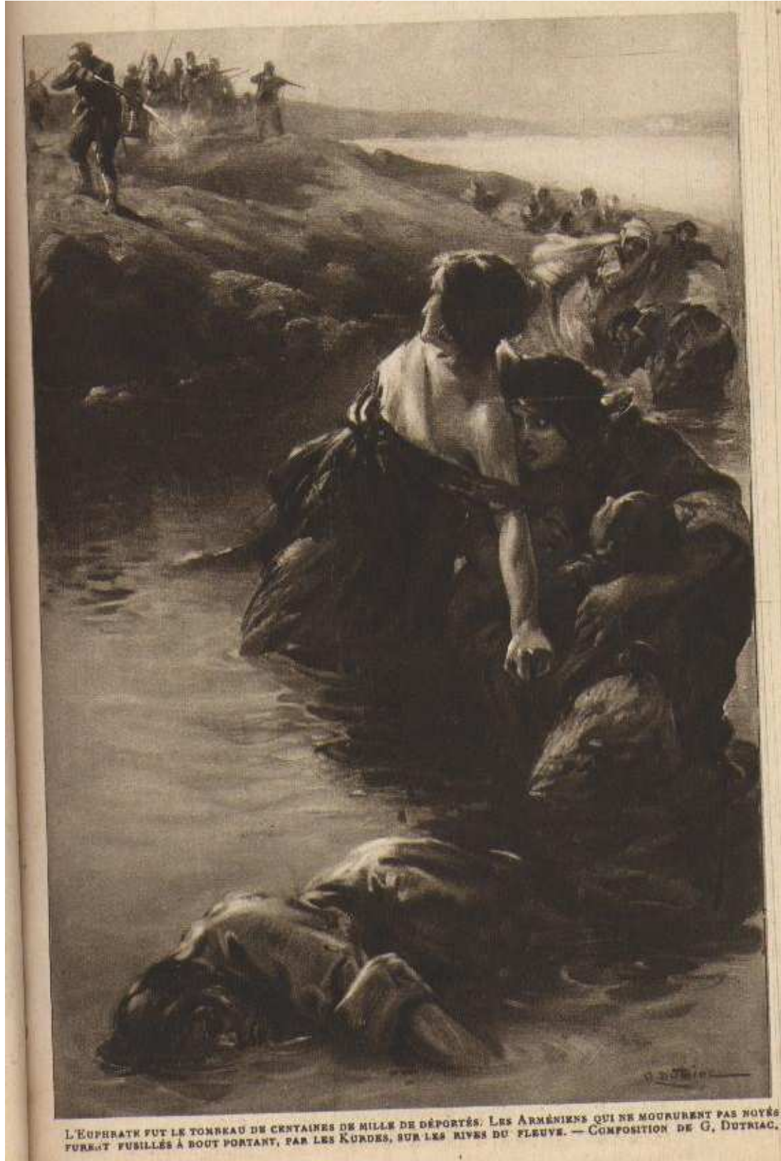
L'EUPHRATE FUT LE TOMBEAU DE CERTAINES DE MILLE DE DÉPORTÉS. LES ARMÉNIENS QUI NE MOURURENT PAS NOYÉS FURENT FUSILLÉS À BOUT PORTANT, PAR LES KURDES, SUR LES RIVES DU FLEUVE. — COMPOSITION DE G. DUTRIAC.