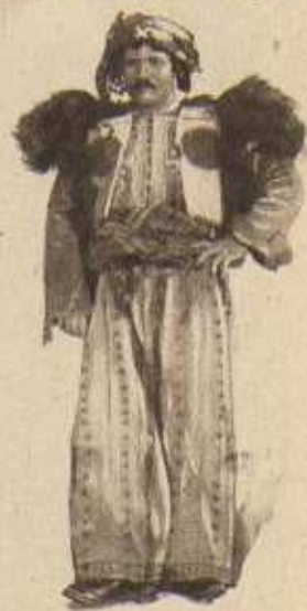
TYPE DE MASSACREUR. — UN CHEF KURDE.

Se souvient-on de l'époque où les Jeunes-Turcs résolurent de débarrasser Constantinople des bandes de chiens qui peuplaient les rues ? Les malheureux animaux, rassemblés, avaient été mis sur des bateaux et transportés dans une île déserte où ils durent mourir de faim. Pour les Arméniens, hommes, femmes, vieillards, enfants, le Turc fut plus cruel, plus impitoyable que pour les chiens de Constantinople ! Tout d'abord, leurs biens mobiliers et immobiliers sont recensés : tout ce qui a une valeur est mis de côté pour être vendu. L'Etat s'enrichira d'autant ! Le partage des femmes et des enfants se pratique à l'occasion. Tout Turc qui a besoin d'un domestique prend un esclave. Il y a des marchés. Des jeunes filles sont vendues 2 francs. Ce « travail » préliminaire accompli, les déportations commencent. En route pour le désert, en route pour le martyre ! Mais l'horreur s'échelonne, tout au long des mois, selon les lieux, selon les villes.