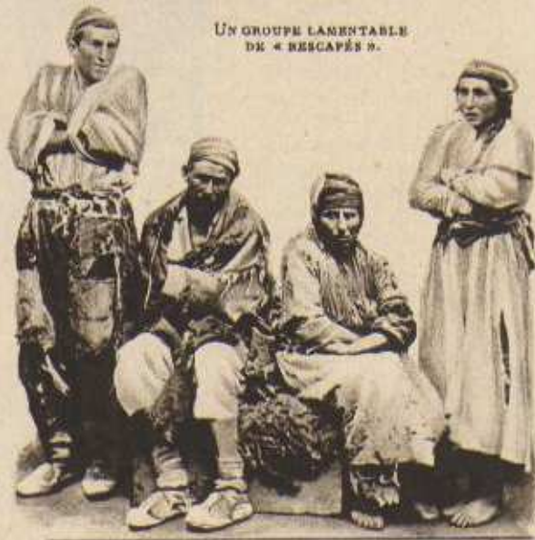
UN GROUPE LANENTABLE DE « RESCAPÉS ».