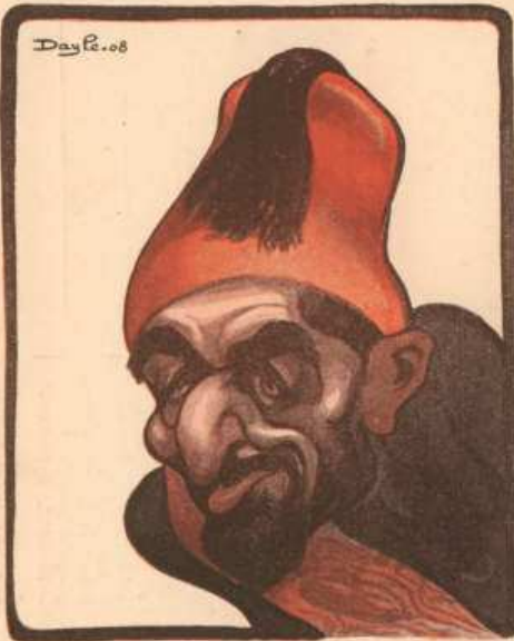
ABDUL-HAMID Sultan de Turquie