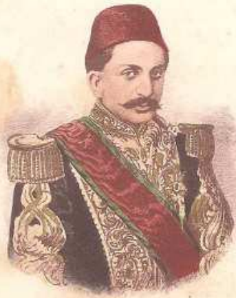
S. M. Abdul-Hamid II

Sultan de Turquie, le 31 Août 1876 Né le 23 Septembre 1842