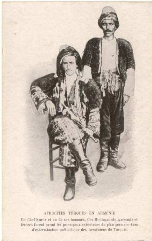
ATROCITÉS TURQUES EN ARMÉNIE Un Chef Kurde et un de ses hommes. Ces Montagnards ignorants et féroces furent parmi les principaux exécuteurs du plan germano-turc d'extermination méthodique des Arméniens de Turquie.