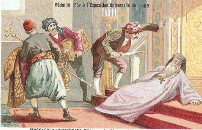
MASSACRES D'ARMÉNIE: Pillage du Monastère de Hassankalé.

Médaille d'Or à l'Exposition Universelle de 1889