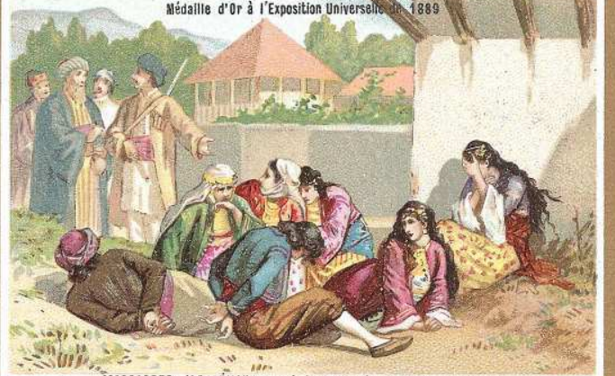
MASSACRES D'ARMÉNIE: Arméniens vendus comme esclaves.

Médaille d'Or à l'Exposition Universelle de 1889