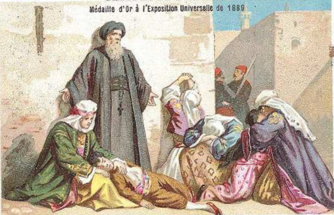
MASSACRES D'ARMÉNIE: Prisonniers chrétiens à Aradkir.

Médaille d'Or à l'Exposition Universelle de 1889