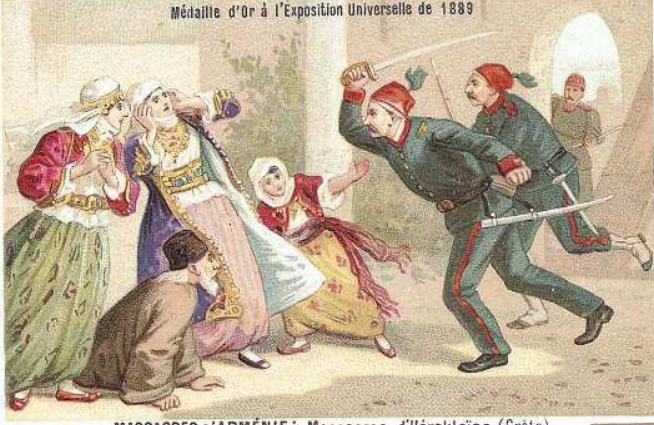
MASSACRES D'ARMÉNIE: Massacres d'Hérakleion (Crète)

Médaille d'Or à l'Exposition Universelle de 1889