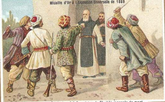
MASSACRES D'ARMÉNIE: Les R.P. Trappistes de Cheiklé menacés de mort.

Médaille d'Or à l'Exposition Universelle de 1889