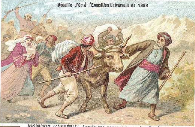
MASSACRES D'ARMÉNIE: Arméniens poursuivis par les Kurdes.

Médaille d'Or à l'Exposition Universelle de 1889