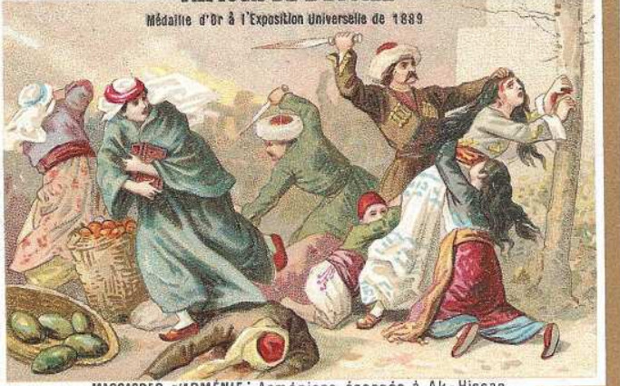
MASSACRES D'ARMÉNIE: Arméniens égorgés à Ak-Hissar.

Médaille d'Or à l'Exposition Universelle de 1889