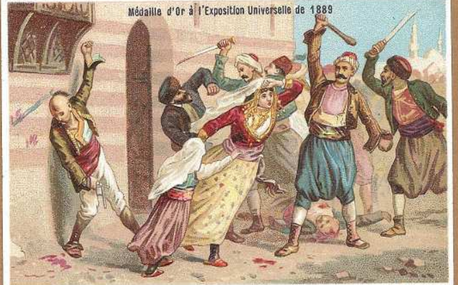
MASSACRES D'ARMÉNIE: Pillage de Trébizonde

Médaille d'Or à l'Exposition Universelle de 1889