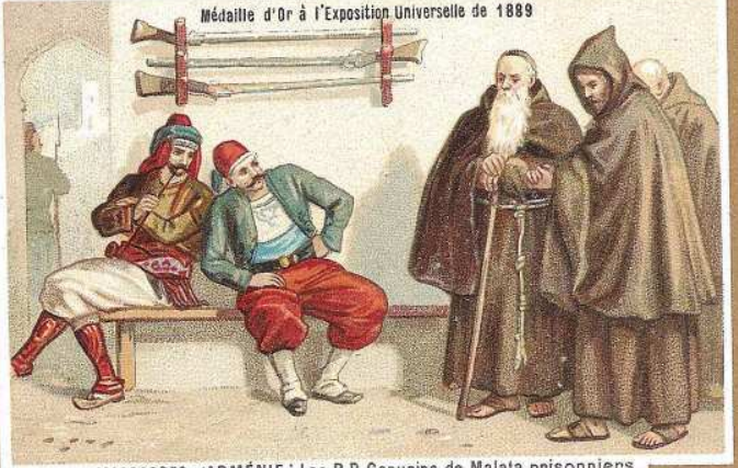
MASSACRES D'ARMÉNIE: Les R.P. Capucins de Malata prisonniers.

Médaille d'Or à l'Exposition Universelle de 1889