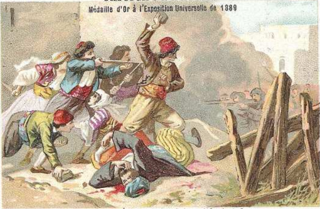
MASSACRES D'ARMÉNIE: Les Arméniens défendant Gurun.

Médaille d'Or à l'Exposition Universelle de 1889