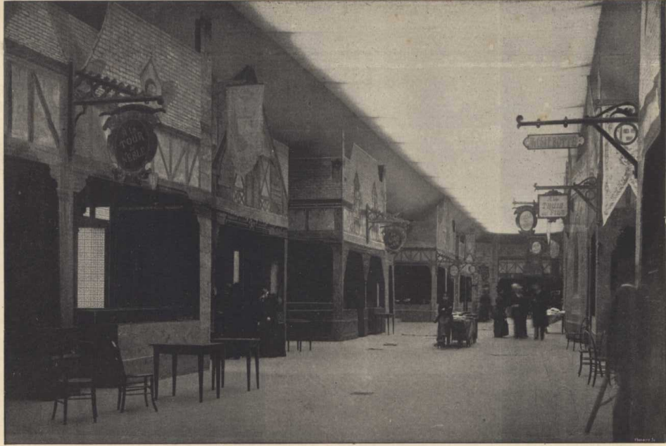
VUE D'ENSEMBLE DU « BAZAR DE LA CHARITÉ » AVANT L'INSTALLATION DES COMPTOIRS