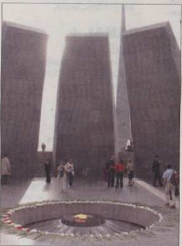
Dzidzernagapert, lieu de mémoire

SITUÉE au sud du massif caucasien, l'Arménie fait frontières communes avec la Géorgie, l'Azerbaïdjan, l'Iran et la Turquie. Dans ce pays essentiellement montagneux alternant plaines, massifs et hauts plateaux, l'Aragats (4 090 m) est le point culminant, mais lorsque l'on arrive à Erevan (prononcer Yérévanne) par la route surplombant la ville, ce que l'on aperçoit en premier, c'est le mont Ararat (5 165 m) recouvert de neiges éternelles se découpant dans le ciel.