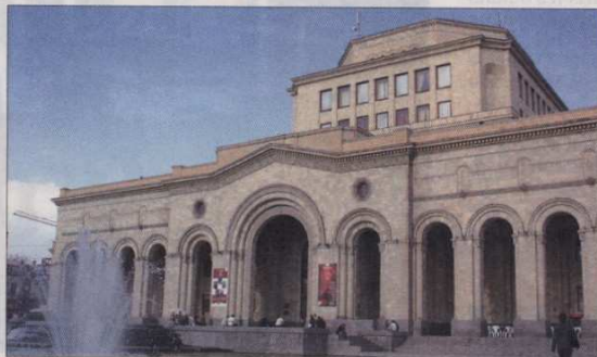
Le musée d'Histoire de l'Arménie date de 1921

Indépendante depuis le 21 septembre 1991, l'Arménie s'ouvre au tourisme. Sans oublier sa douloureuse histoire, ce petit pays grand comme la Belgique veut faire découvrir son riche patrimoine historique, sa nature intacte et ses traditions séculaires.