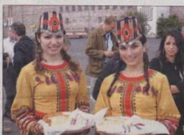
La tradition du partage du pain et du sel

La cuisine arménienne est de renommée mondiale. Le plat principal est composé essentiellement de viande : mouton, agneau ou porc. Le Mante, ravioles à base de viande hachée accompagnés de yogourt saupoudré de sumac et arrosé de citron. Dans ce pays sans mer, la truite du lac Sevan, l'ich-