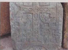
Un khatchkar, toujours dressé vers l'Ouest

khan, est réservée aux hôtes de marque. Les fruits de saison (grenades, pastèques et prunes d'Arménie) peuvent être servis avec les pâtisseries aux noix et aux amandes gorgées d'un épais sirop, les Baklava ou Bourna. Autant de plats valorisés par le Tan, boisson traditionnelle au goût légèrement acide très désaltérant, et par le Guétap et l'Aréni, vins produits