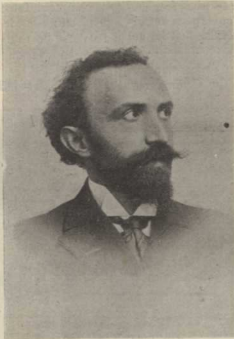
LE POÈTE ARCHAG TCHOBANIAN, DIRECTEUR DE L'« ANAHIT », REVUE ARMÉNIENNE

Plus près de nous, ce sont encore : Bedros Tourian, le sensitif ; Kamar-Katiba, l'énergique ; Khatchatour Abovian, dont le cœur saigne dans les « Blessures de l'Arménie », et Béchik-tachélian, au nocturne tragique. Enfin, parmi les modernes, maints bons poètes, d'un esprit très près du nôtre, continuent dignement les traditions de leurs aînés tout