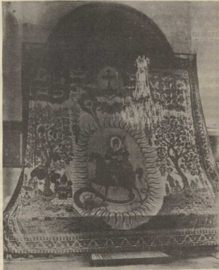
RIDEAU COUVRANT LE SAINT AUTEL, A LA CATHÉDRALE D'ETCHMIADZIN