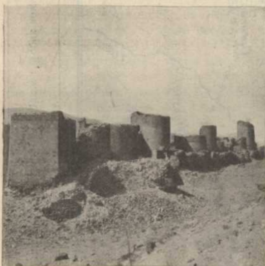
LES FORTIFICATIONS D'ANI, CAPITALE DES BAGDATIDES

A partir de 1305, l'Arménie commence sa marche au calvaire. Les Mongols de Gengis Khan déferlent sur cette région