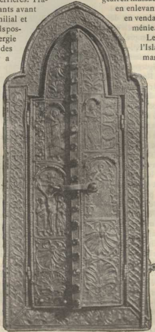
RELIQUAIRE CONTENANT UN FRAGMENT DE LA SAINTE LANCE, A LA CATHÉDRALE D'ETCHMIADZIN

Les alliés ne sauraient, hélas! secourir ce peuple sacrifié. Il n'en existera plus un seul représentant dans la Turquie