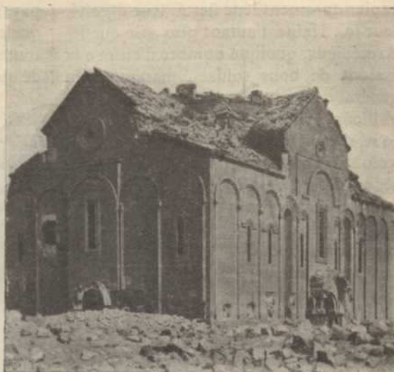
LA BASILIQUE D'ANI

D'autres Arméniens pâtirent des conséquences de la guerre. Ceux qui durent quitter Van lorsque les Russes évacuèrent cette ville périrent en foule soit à la suite de privations, soit sous les coups des Kurdes. Et quand les survivants parvinrent au Caucase, ils étaient encore trop nombreux pour être secourus effica-