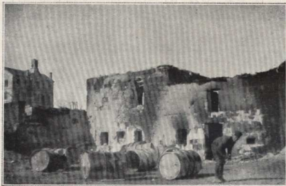
Au collège d'Aïntab : un dépôt incendié par le bombardement turc.

2.000 réguliers et 1.500 irréguliers sont refoulés dans le quartier turc où ils