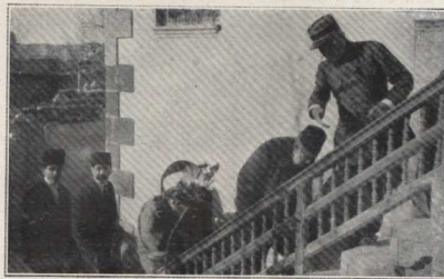
Arrivée des parlementaires au P. C. français d'Aïntab pour signer la capitulation.

Le drapeau français est hissé sur la citadelle d'Aïntab ; de toutes les collines environnantes, des milliers de soldats se lèvent et saluent avec une émotion indi-