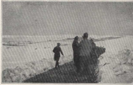
Déblaiement d'une piste.