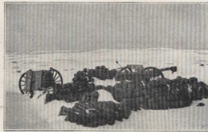
Canon de 77 en position.

DEUX PHOTOGRAPHIES QUI PERMETTENT DE SE FAIRE UNE IDÉE DE CE QUE FUT LA CAMPAGNE D'HIVER DE NOS TROUPES DEVANT AÏNTAB