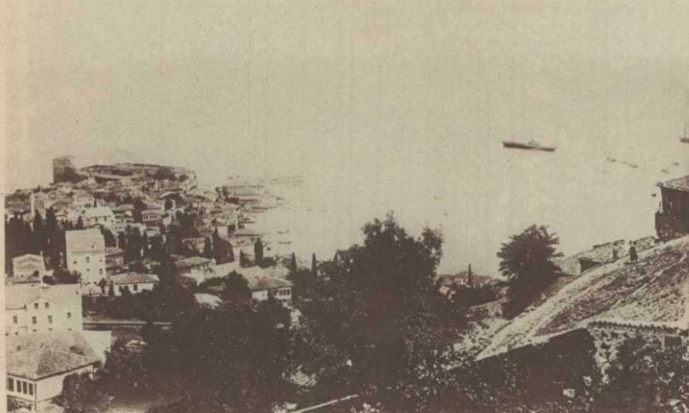
La rade de Trébizonde

L'existence du port de Trébizonde remonte aussi haut, que le commerce d'exportation de l'Arménie. Ce fut de tous temps l'aboutissement naturel des caravanes venant de la Perse et de la vallée du Tigre, à destination de la mer.