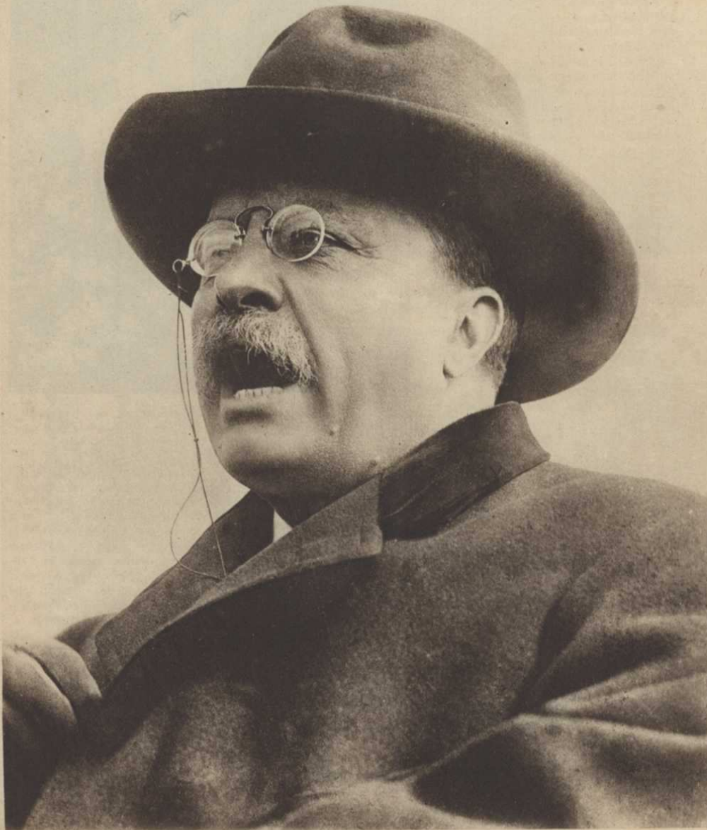
ROOSEVELT A PARLÉ, L'AMÉRIQUE PREND PARTI

ALBUMS-RELIÉS SÉRIE de 24 NUMÉROS Couverture brochée Fr. 3.50 " cartonnée Fr. 4.- S'ADRESSER AUX DÉPOSITAIRES ou à l'Éditeur SADAQ PARIS 19 e 3, Rue de Mogador