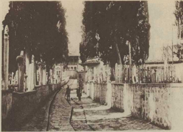
Trébizonde. — Rue de la mosquée d'Imaret

Il n'est pas probable que les soldats, ni même les généraux russes se soient longtemps attardés à ces grands souvenirs. Ils ont trouvé une ville riante du dehors, étagée en amphithéâtre dans un des plus beaux sites de l'Orient, ponctuée de clochers et de minarets, mais, comme toutes les cités où la domination turque s'est prolongée, très sale à l'intérieur avec un dédale de petites rues étroites. Longtemps la prospérité de Trébizonde fut célèbre. Elle était le point de départ des relations commerciales entre la Perse et l'Europe. Ce temps n'est plus. La ville doit compter quelque quarante