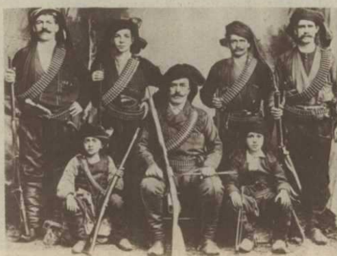
Types de soldats caucasiens

de là que César put écrire Veni, vidi, vici , après avoir écrasé Pharnace, fils du grand Mithridate. Les Romains l'avaient embellie de palais, de colonnades et de basiliques. La citadelle, que viennent d'enlever les Russes, est l'œuvre de Justinien. Au treizième siècle, Trébizonde devint la capitale d'un duché, appelé aussi royaume et même empire, fondé par David et Alexis Comnène, qui fuyaient les