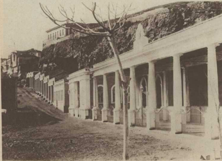
Le dépôt militaire de Trébizonde

On remarquera la richesse du portique aux colonnes éblouissantes de lumière.