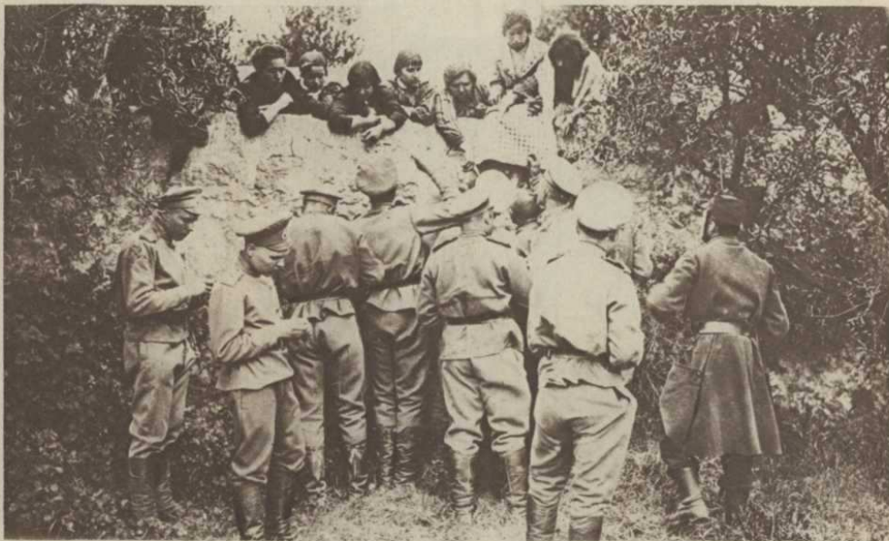
Une entente vraiment cordiale !!

Et nous partimes le long de la route, où serpentait, dans le cadre radieux du golfe, au soleil, le splendide flot des hommes ».