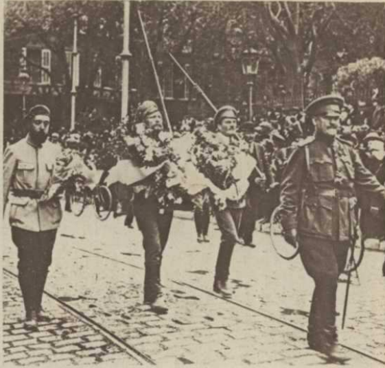
Les héros fleuris

— Eh bien ! me dit-il, bonjour ami. Nous voilà. Vous voyez bien qu'avec sa patrie, tout homme, digne