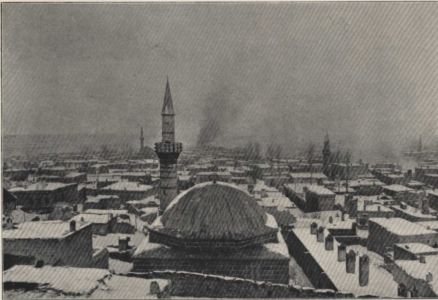
Vue générale d'Erzeroum, prise de la citadelle, le lendemain de l'occupation de la ville, quand brûlaient encore les incendies allumés par les Turcs, sur divers points, avant l'évacuation.