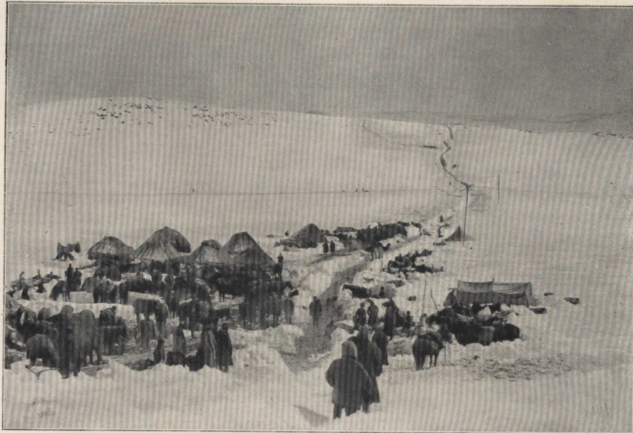
L'état-major de la 4 e division des chasseurs du Caucase campé au sommet du plateau de Kargabazar; à droite, le long de la piste, deux mâts portent les antennes de télégraphie sans fil.