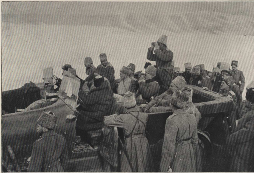
Le Grand-Duc, assis, regarde à la jumelle.

A trente kilomètres de la ville et à deux kilomètres de la ligne de feu, le Grand-Duc suit les mouvements de son armée, lancée à la poursuite de l'armée turque en retraite.