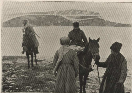
L'interrogatoire d'un officier turc prisonnier qui, ayant les pieds gelés, a été hissé sur un cheval.