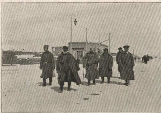
Un des petits groupes de prisonniers faits, après l'occupation d'Erzeroum, par les Russes poursuivant les Turcs dans la direction d'Ach-Kalé.