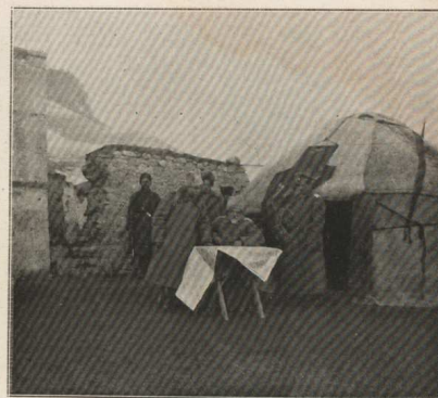
Le général Kalitine, commandant d'un des corps d'armée, suit sur la carte le rapport d'un officier d'état-major.