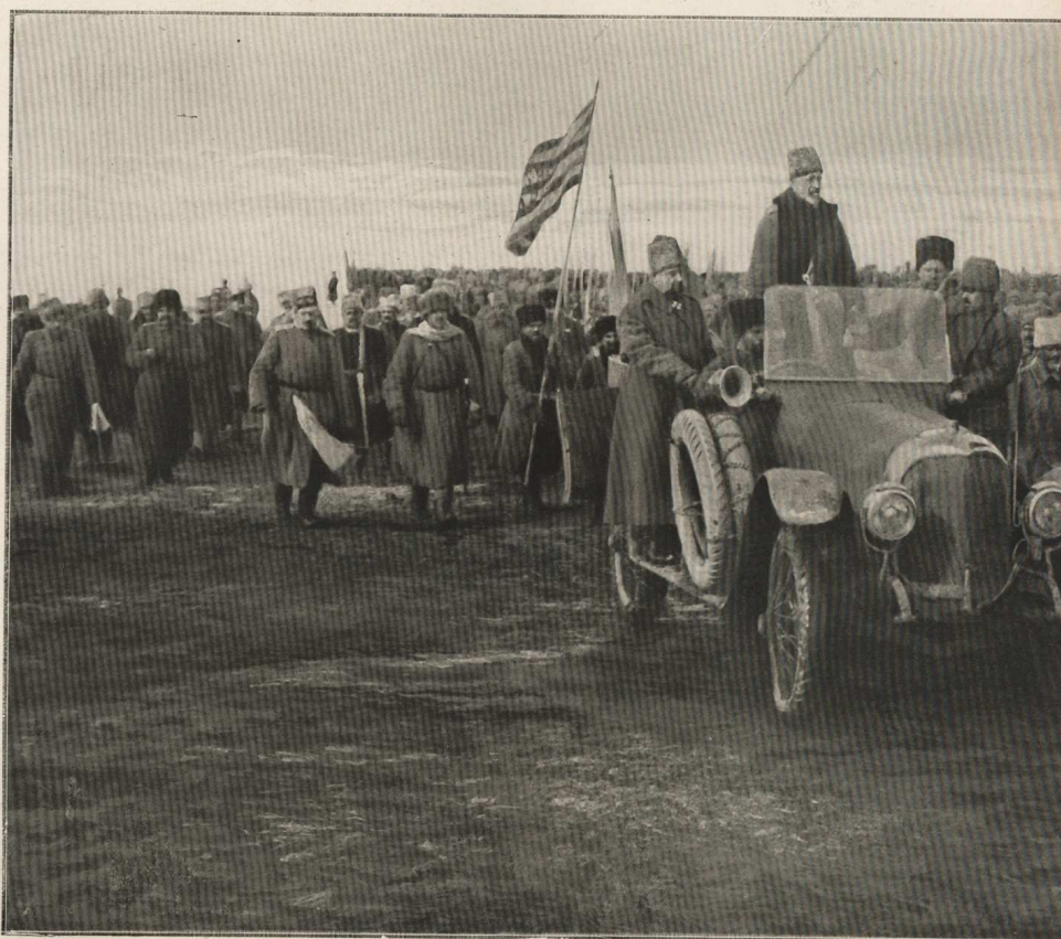
LE GRAND-DUC APRÈS ERZEROUH ET AVANT TRÉBIZONDE : LE GRAND-DUC NICOLAS PASSE EN REVUE SES SOLDATS à 30 kilomètres d'Erzeroum,