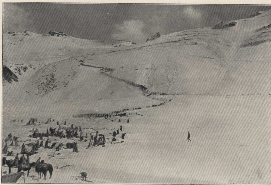
Les chasseurs du Caucase descendent du plateau de Kargabazar pour atteindre Erzeroum; trois petits groupes, se détachant en noir à mi-hauteur, au centre, font glisser des canons le long de la pente.

LA CAMPAGNE D'HIVER DES RUSSES EN ARMÉNIE