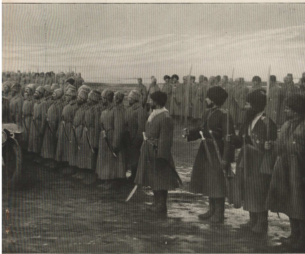
LDATS VICTORIEUX. — L'automobile du Grand-Duc, suivie de son porte-fanion, avance lentement devant le front des troupes, dans la direction de Trébizonde.