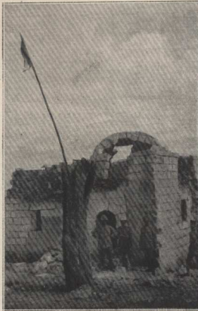
Le marabout d'Aintab perdu le 2 mai, repris le 23.