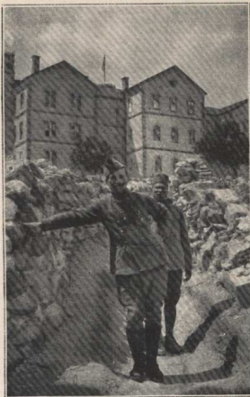
Le boyau Nord du Collège américain.

Les hostilités des nationalistes débutèrent à Marasch dans la deuxième quinzaine de janvier. Après une dure bataille de rues de près de trois semaines, et à la suite de l'intervention inefficace de colonnes de secours trop faibles, la garnison de Marasch et une partie de la population arménienne quittèrent la ville et se replièrent vers le Sud, sur Islahié. Au cours de cette retraite, rendue extrêmement pénible par des tempêtes de neige d'une violence inouïe, près de 2.000 Arméniens moururent de froid et de faim; beaucoup de Sénégalais eurent les pieds gelés. Les débris de cette colonne parvinrent à Islahié dans un état de fatigue et de misère indescriptible. Cent cinquante prisonniers environ étaient restés à Marasch aux mains des Turcs.