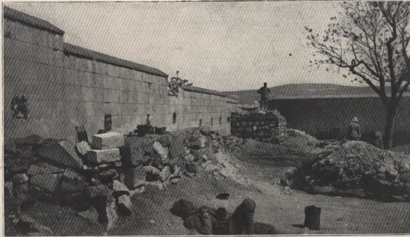
Mur d'enceinte du poste de commandement à Aintab.