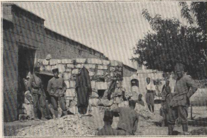
Construction d'une casemate pour canons de 37.