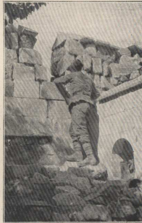
Un guetteur à son créneau.

LA DÉFENSE D'AÏNTAB (CILICIE) PAR LES TROUPES FRANÇAISES, AU PRINTEMPS DE 1920