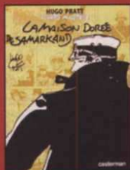
Enver Pacha, ministre « Jeunes-Turcs » qui rencontra le marin inventé par Hugo Pratt, Corto Maltese, dans le lyrisme « La maison dorée de Samarkand » (Editions Casterman).

Mais on sait qu'un nouveau mouvement nationaliste émergea en Anatolie sous la direction de Mustafa Kemal (Atatürk). Menant une guerre d'indépendance (1918-1923), Mustafa Kemal parvint à résister aux exigences des Alliés, expulsa les forces d'occupation grecques, britanniques, françaises et italiennes, et imposa un accord concrétisé par le traité de Lausanne (1923). Par ce nouveau traité qui rendait caduc le traité de Sèvres, les régions turques de la Thrace et de l'Anatolie orientales furent autorisées à former leur propre État. La république de Turquie fut proclamée et elle devait être dirigée de main de fer durant quinze ans par Mustafa Kemal dit Atatürk, (le «père des Turcs»). Cette fois-ci, la répression s'abattit sur les Kurdes, les anciens alliés des Turcs contre les Arméniens.